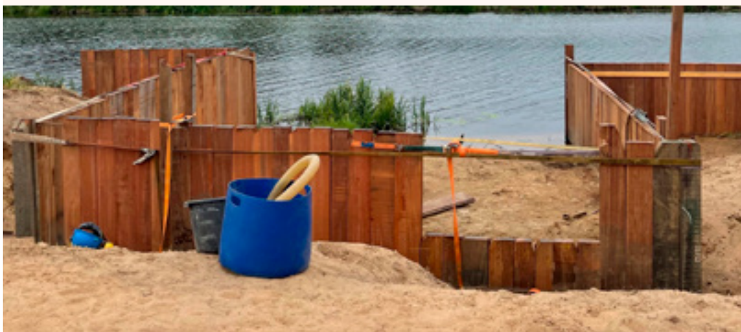
Het pontje in aanbouw

aan beide zijden van de Vecht recreatieve arrangementen organiseren. Een stevige impuls voor de lokale economie. Het is de bedoeling dat dit pontje, samen met een uitzichtpunt, voor de zomer van 2021 worden opgeleverd.