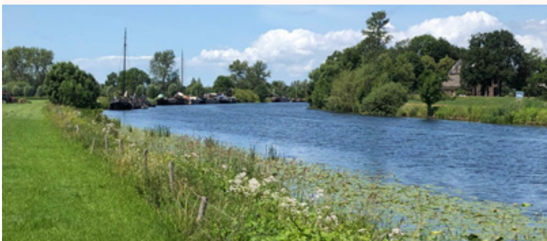
Vechtoevers bij Berkum (Zwolle) dat een beeld geeft van de plek van het laarzenpad.

Deze werkzaamheden worden gecombineerd met het project Slenken Kranenkolk. In de uiterwaarden van de Vecht liggen veel kolken en slenken. Om de biodiversiteit, vooral het leefgebied voor vis, verder te verbeteren en om de beleefbaarheid van het gebied te vergroten worden maatregelen genomen om oude slenken in de uiterwaarden van de Vecht te herstellen. In dit project gaat het vooral om het herstel van deze cultuurhistorisch waardevolle landschappelijke elementen.