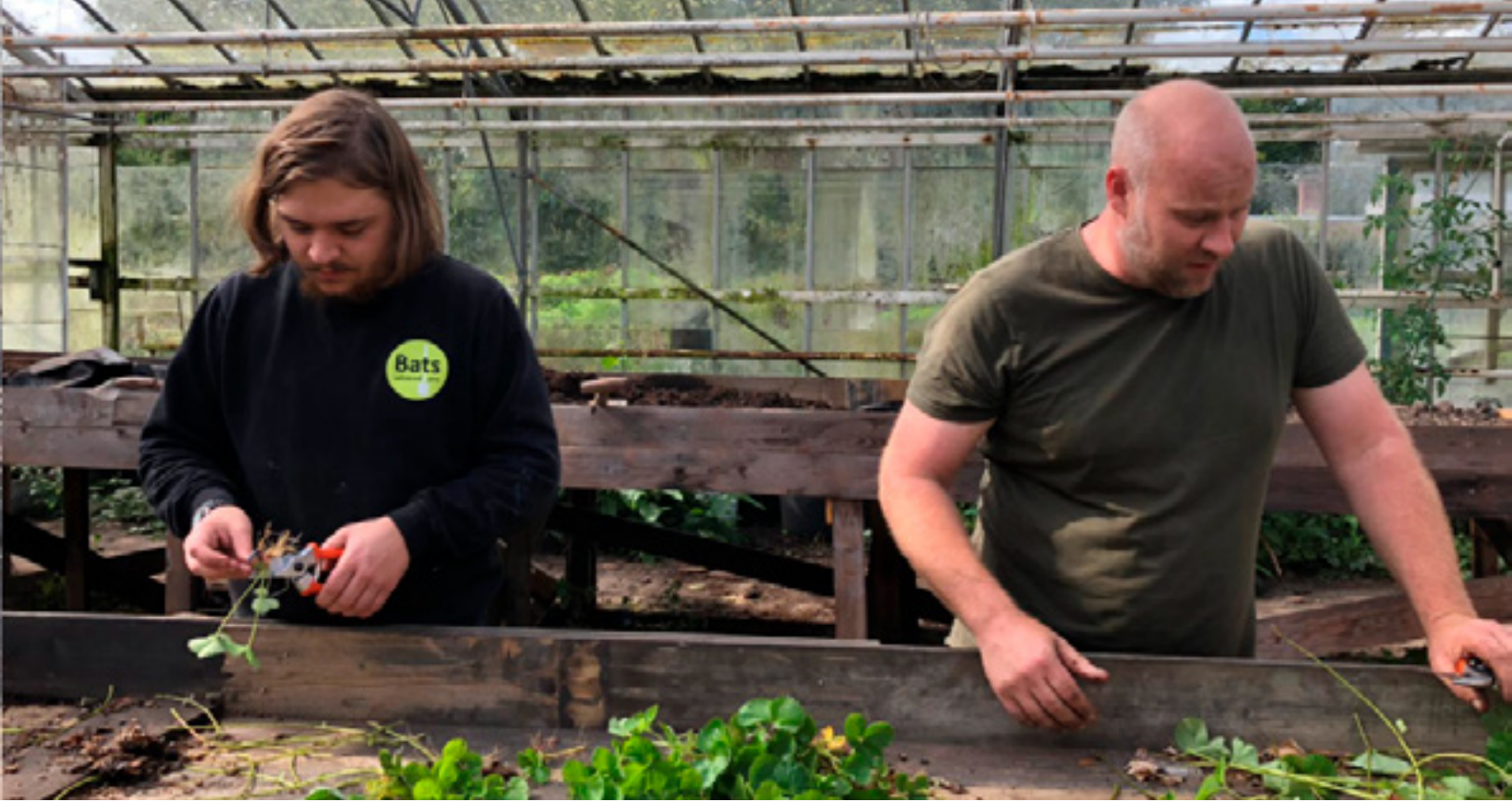
Mensen in de voormalige tuinbouwschool in Frederiksoord aan het werk met de korona aardbei. Van deze aardbei wordt balsamico azijn gemaakt.