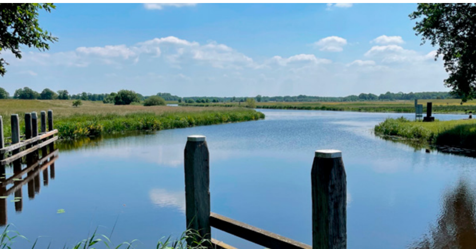
Impressie van de Vecht

Het project 'Brede welvaart in het Vechtdal' kwam al eerder aan bod. Met 23 deelprojecten brengt dit project de ontwikkeling van de nieuwe demodelta in de praktijk. Bijvoorbeeld met het initiatief 'Klimaatwinkelstraat Dalfsen'. In samenwerking met ondernemers, bewoners, het waterschap en de gemeente Dalfsen wordt een klimaatadaptieve winkelstraat gerealiseerd. Verharde terreinen worden vergroend en waterbelevingselementen worden toegevoegd. De maatregelen hebben twee doelen: hittestress en wateroverlast beperken en het creëren van een aantrekkelijk 'groenblauw' winkelgebied. Een ander voorbeeld is het deelproject Vechtrijk Gramsbergen. Samen met betrokkenen maken gemeente Hardenberg en waterschap Vechtstromen een plan voor dit gebied. Het doel is een waterrijk gebied langs de Vecht voor wandelen, fietsen, varen en om natuur te beleven met behoud van de huidige landbouw.